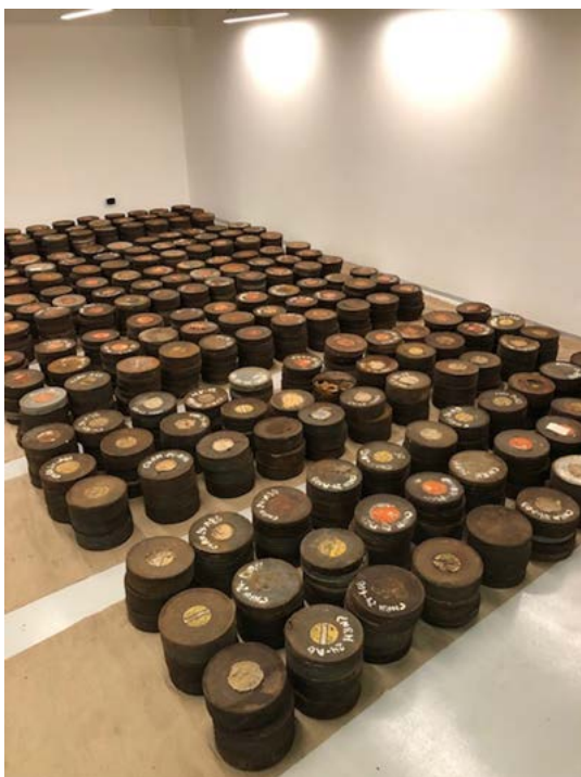
Figura 4. Latas del NB distribuidas en el sexto piso del AGN

tenemos más que una copia de proyección de los noticiarios y los documentales. La existencia de negativos mantiene viva la esperanza de hallar los negativos de cámara y/o los empleados para realizar el tiraje de copias. La presencia de copias de 16 mm comprobaría el empleo de cine-móviles provinciales, transportes especialmente acondicionados para la proyección de películas en las localidades de la provincia que no contaban con salas de cine. También sirve para comenzar a pensar estrategias de organización del trabajo por venir; por ejemplo, el dato de que las placas de inicio del noticuario cambiaron con cada gestión gubernamental nos provee un posible primer criterio de ordenamiento intelectual del material. De igual modo, y ante la eventual ausencia de estas, se pueden emplear otros indicadores provistos por el contexto histórico, tales como la mención al Plan Trienal, correlativo y complementario del Primer Plan Quinquenal del gobierno nacional, o la presencia del logo del Segundo Plan Quinquenal en los intertítulos separadores de noticias durante la gobernación del mayor Carlos Aloé.