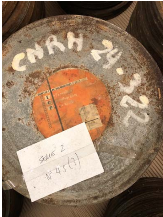
Figura 3. Contenedor con etiqueta legible y número de inventario asignado en el CNRH