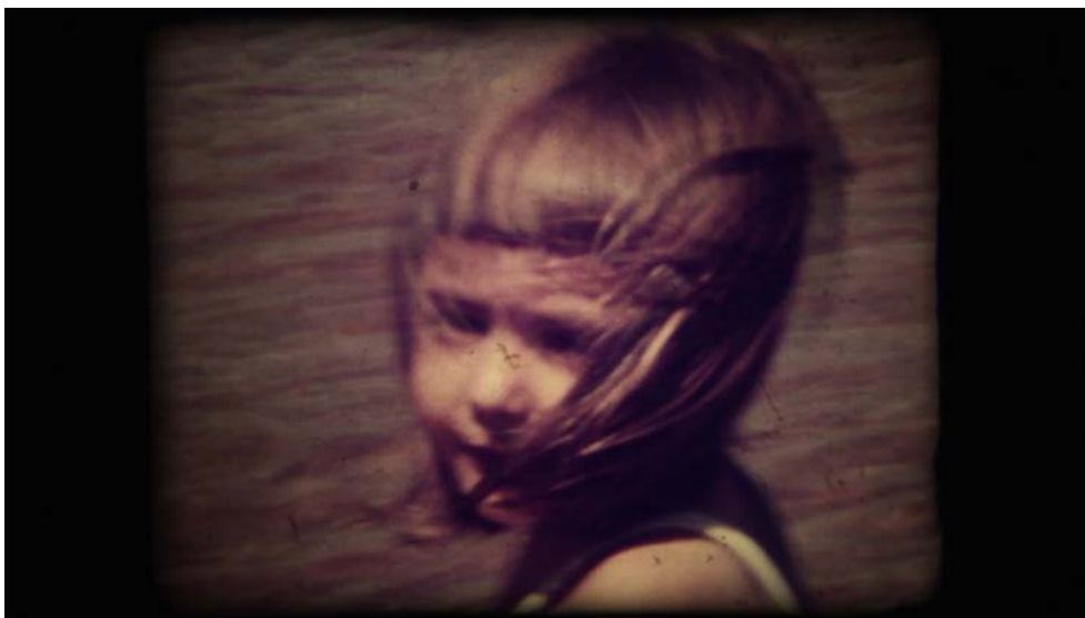
Figura 2. Nubes de febrero (2018), de Lucía Torres Minoldo. Montaje: Lucía Torres Minoldo.

Tenemos un conocimiento aprendido acerca de cómo enfrentar un material, de saber cómo mirarlo, cómo organizarlo o cómo internalizarlo; recordar los planos para poder después volver a ellos. Este proceso está acompañado de algo que tiene que ver con lo intuitivo, en el sentido de ir por caminos donde la racionalidad —que suele estar puesta en la estructura o en analizar el dispositivo— en algún momento nos puede llevar a probar ir por otros lados. Por tanto, si bien la intuición existe y está presente, lo que hacemos es encauzarla. Pero de ninguna manera creo que se pueda montar una película solo con intuición, de hecho, estas herramientas y conceptos se aprenden justamente a partir de la experiencia en el trabajo, después de haberte enfrentado al material muchas veces para dominar ese caos inicial.