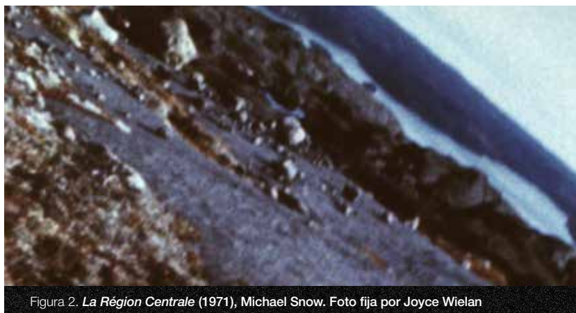
Figura 2. La Région Centrale (1971), Michael Snow.