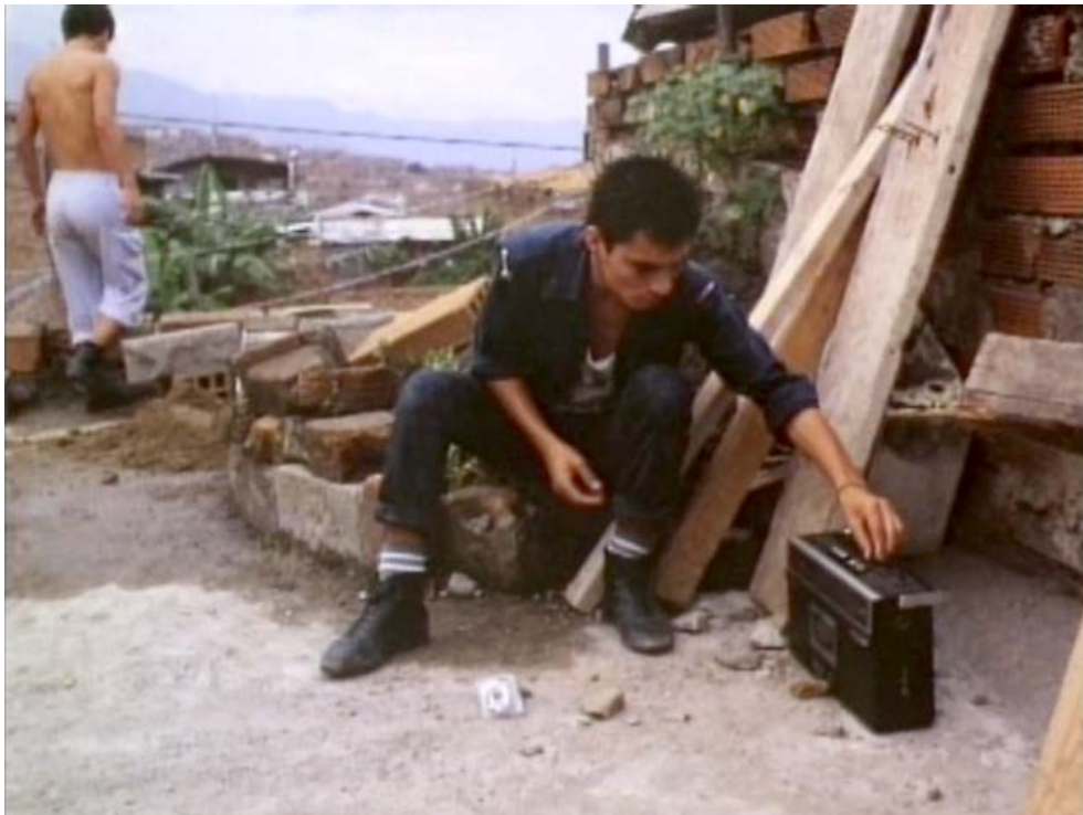
Figura 1. Rodrigo D: no futuro (1990), de Víctor Gaviria

Este tiempo es situacional, epocal: da al territorio un drama, un conflicto o una situación determinada que se juega en un periodo de tiempo. La película colombiana Rodrigo D. No futuro (1990), de Víctor Gaviria [Figura 1], gira en torno a grupos de jóvenes punks de Medellín, a fines de los años ochenta, cuando la violencia del narcotráfico y la figura de Pablo Escobar asolaban la ciudad. Gaviria organizó un guion y puso a actuar a jóvenes de la ciudad, bajo una banda sonora compuesta por los grupos punk y metal que habitaban los cerros de Medellín. La película ha sido cuestionada (Oquendo, 2018) pues vincula la sensibilidad punk al sicariato, vínculo repudiado por algunas de las comunidades punks de la época. Ahora bien, en términos de composición cinematográfica, el uso musical define la sensibilidad epocal del territorio. El conflicto entre las fuerzas opresoras y los deseos truncados de la comunidad que habita en un tiempo determinado el espacio donde ellas operan genera una sensibilidad representada por la música. La música es caracterización espacio-temporal. La música caracteriza una época del territorio a través de la sensibilidad que lo habita. Por lo general, da al territorio un carácter subjetivo, a la manera en que Friedrich Hegel [1826] (2006) comprendía el sonido: interioridad. El espacio se vuelve territorio cuando una subjetividad histórica lo define.