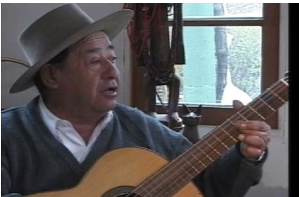
Figura 4. Cofralandes 2: Rostros y rincones (2016), de Raúl Ruiz

En Cofralandes 2: Rostros y rincones (Ruiz, 2002b) vemos a varios cantantes a lo humano y a lo divino recitando, repartándose los turnos. La escena se transforma en una especie de concierto, la cámara parece estar produciendo un registro, salvando una memoria. El tiempo y la continuidad del film parecen suspenderse para escuchar a los cantores, reliquias vivas [Figura 4]. Pero junto con la memoria, se trata también de la belleza del acontecimiento. Sin quedarse en rigor quieta, la cámara no puede dejar de observar y escuchar a los cantores.