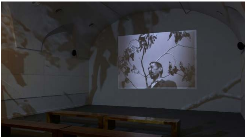
Figura 1. Aguaespejo granadino (1953–1955), de José Val del Omar, proyectada con desbordamiento apanorámico de la imagen

Pocos años más tarde, Carlos Fernández Cuenca [1965] (2015) realizaba un balance de la recepción crítica del cineasta, en el que se resaltaban sus hallazgos de montaje. Por lo común, en la brevedad de las reseñas se señalaba un montaje que sobresalía por su potencial poético, sin ahondar en precisiones, o a lo sumo cotejándolo con el de otros autores ligados a la vanguardia histórica. En años más recientes, Thomas Beard (2010) ha relacionado al montaje de Val del Omar con ciertas operaciones llevadas a cabo por artistas norteamericanos como Joseph Cornell o Kenneth Anger, y contraponiéndolas con la de su connacional Luis Buñuel. Por su parte, Brenez (2010) enfatizó la conexión con Gance, a lo cual podríamos agregar una parcial cercanía con Dziga Vertov. Sin desestimar las notables diferencias entre el granadino y el cineasta soviético, cabe resaltar que ambos comparten una común preocupación por el montaje sonoro, tan importante como el visual para ambos. Es preciso recordar que Aguaespejo granadino fue también oportunidad para la presentación de la tecnología visual bautizada por Val del Omar como Tactilvisión , y de su sistema sonoro presentado como Diafonía , que proponía como alternativa al sonido estéreo en auge durante los años cincuenta [Figura 1].