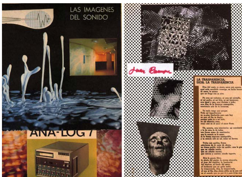
Figura 3. Dos collages de Val del Omar