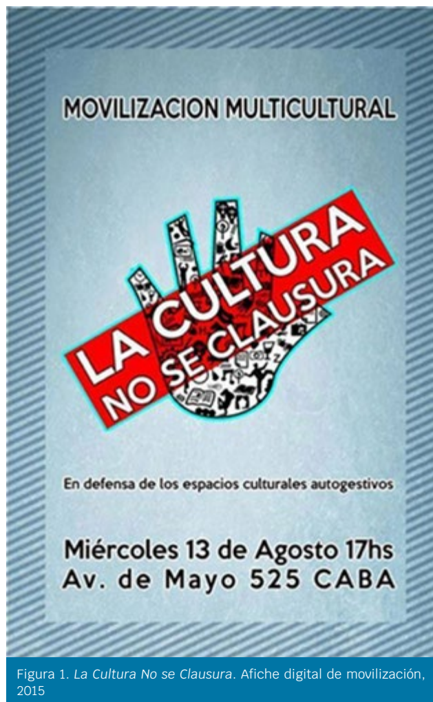
Figura 1. La Cultura No se Clausura . Afiche digital de movilización, 2015

proyecto de ley fuese tratado durante aquel año, en él se clausuraron espacios culturales con alarmante cotidianeidad. Por ese motivo, una de las manifestaciones más importantes del ala cultural independiente fue realizada bajo el lema La cultura no se clausura [Figura 1]. Junto con el MECA nació, también, Abogados Culturales , una organización cuyo fin es defender la cultura independiente y autogestiva de la Ciudad Autónoma de Buenos Aires, asistiendo a espacios, productores y artistas. Este espacio entiende la cultura como un vehículo de transformación, por eso los abogados allí agrupados brindan asesoramientos, acompañamientos y ayuda (Club Cultural Matienzo, s. f.).