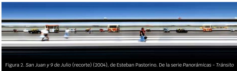
Figura 2. San Juan y 9 de Julio (recorte) (2004), de Esteban Pastorino. De la serie Panorámicas - Tránsito

A lo largo de este texto articularemos un conjunto de conceptos que nos permiten pensar la fotografía como la visibilidad de una experiencia; estos conceptos provienen tanto del campo de la fotografía como de otros discursos cercanos, especialmente de la literatura y del cine. Queremos destacar la noción de traducción que servirá de guía a la hora de entender y de definir la imagen fotográfica. Seguimos a Eduardo Cadava quien, en su texto Trazos de Luz. Tesis sobre la fotografía de la historia (2014), recupera algunas nociones benjaminianas para pensar con relación a la tarea del traductor: