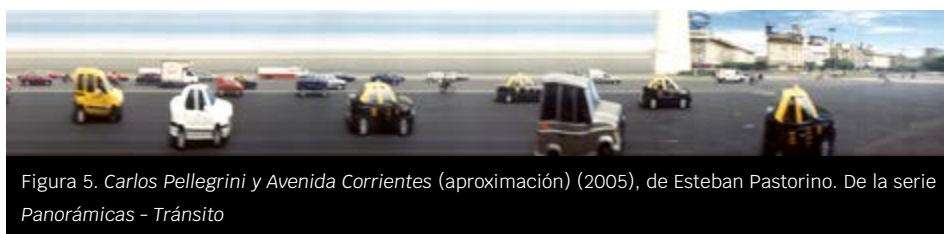
Figura 5. Carlos Pellegrini y Avenida Corrientes (aproximación) (2005), de Esteban Pastorino. De la serie Panorámicas - Tránsito

En este caso, la diferencia sustancial entre una serie y otra no está dada por el cambio de procedimiento o de dispositivo a utilizar —como en otras obras del fotógrafo—, sino por el motivo a fotografiar. En Panorámicas - Pueblos Rurales el paisaje se veía modificado por el procedimiento y el indicio del movimiento, pero el fondo podía ser reconocido, es decir, lo icónico predominaba; esta serie propone un cambio al producir una inversión respecto a las figuras en movimiento y el fondo. Lo estático del espacio se traduce en una imagen barrida donde lo icónico se desdibuja por completo para transformarse en una superficie