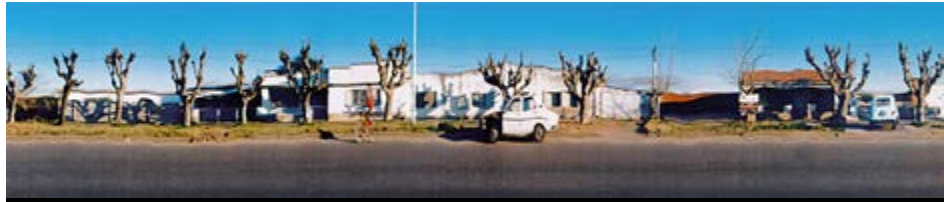
Figura 3. Panorámicas - Pueblos Rurales (aproximación) (2000), de Esteban Pastorino