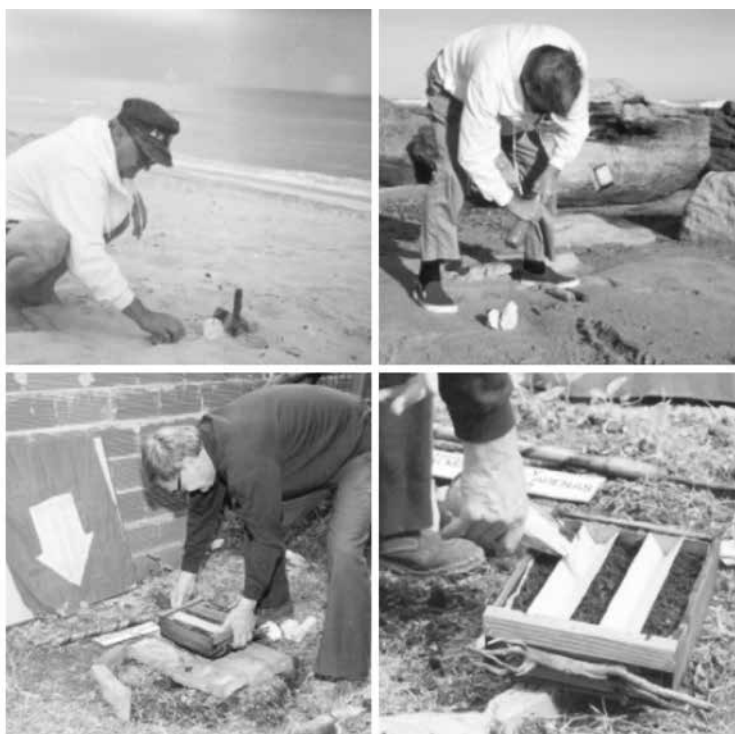
Figura2. Señalamiento N.º 19 (1992), Edgardo Vigo

En este marco, podemos mencionar el Señalamiento N.º 19, que se denomina «Transplante y Almácigo de Arenas» [Figura 2] y fue realizado en el transcurso del año 1992.