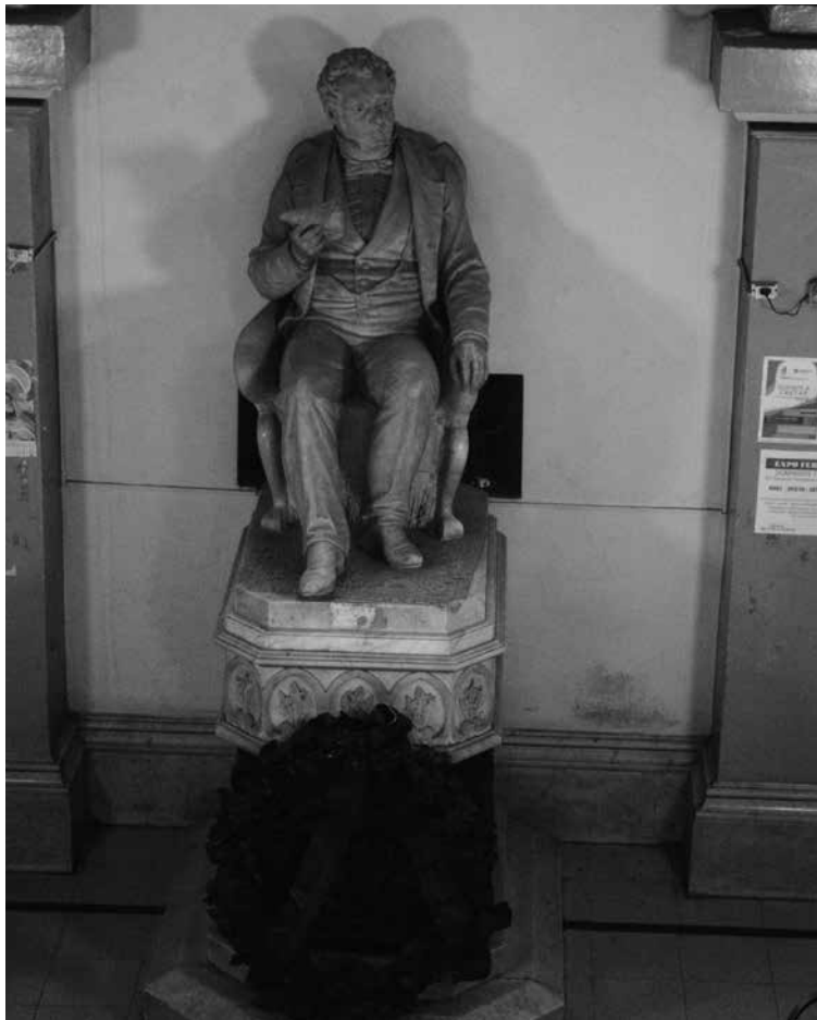
Figura 1. Rivadavia de sentado (c.1885), Pietro Costa. Fotografía de la estatua en su actual emplazamiento

(1909) y relocalizada en fecha incierta en el descanso de la escalera central de Dirección General de Cultura y Educación, donde permanece hasta la actualidad. Las figuras de los miembros de la Primera junta, llegadas en el mismo encargo, también tuvieron un destino imprevisto, ya que poco tiempo después de la inauguración del monumento este fue desmantelado y las estatuas fueron relocalizadas individualmente en plazas públicas de la ciudad (González, 2000: 143) [Figura 1]. 3