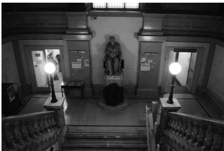
Figura 5. Rivadavia Sentado (c. 1885). Fotografía de su actual emplazamiento en el descanso de la escalera de la Dirección de Cultura y Educación de La Plata

auguraba para La Plata a modo de centro cultural y de enclave político de la nación como el posterior abandono y olvido de aquel sueño utópico de la generación del ochenta [Figura 5].