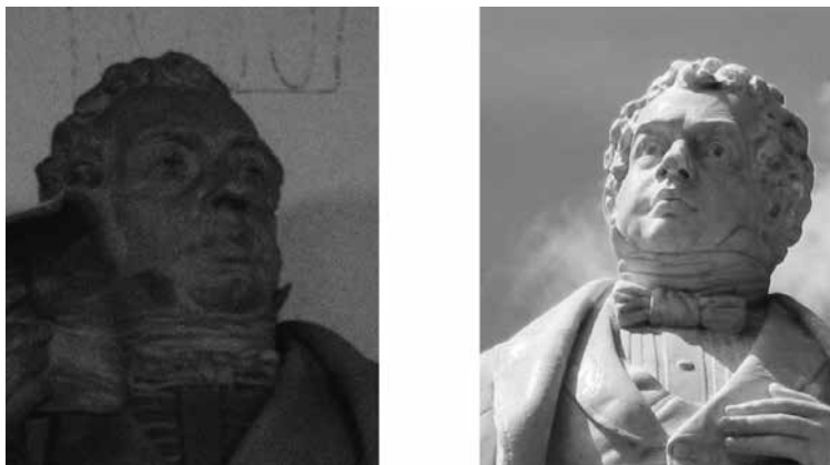
Figura 2. Izquierda: detalle de Rivadavia de Pie (1901), de Pietro Costa, ubicado en Plaza Rivadavia, La Plata. Derecha: detalle de Rivadavia sentado (c.1885), de Pietro Costa, ubicada en 1909 en la Dirección General de Cultura y Educación, La Plata

En los diversos trabajos acerca de la escultura platense encontramos indicios no del todo exactos sobre el devenir del primer Rivadavia. Mientras que Alberto de Paula (1987) supone que la estatua que arribó al puerto es la ubicada actualmente en el centro de la Plaza Rivadavia, desconociendo la existencia del primer encargo (de Paula, 1987: 211), González (2000) sugiere acertadamente que es la que se encuentra en la Dirección de Cultura y Educación, aludiendo a la concordancia de la escultura con los consejos de Lamas y destacando la inferior calidad de Rivadavia de pie (González, 2000: 85-90). Asimismo, en el Programa de inventario y catalogación de esculturas en espacios públicos de la Ciudad de La Plata (2001), confeccionado por González, se menciona a la estatua pero se la deja fuera del catálogo por tratarse de una escultura emplazada en un espacio cerrado (González y otros, 2001: 9).