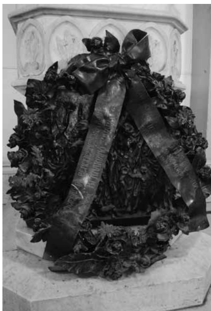
Figura 3. La corona de bronce donada por la Sociedad de Beneficencia aún se encuentra adosada al pedestal de la estatua en la Dirección General de Cultura y Educación de La Plata

Por su parte, un día antes, El Argentino , con cierta ironía, publicaba al respecto: «[...] el discurso será escuchado como verdad suprema y absoluta, aunque el 99% de la concurrencia no sepa de Rivadavia otra cosa sino que fue fundador de la sociedad de Beneficencia» ( El Argentino , 17 de abril de 1909: s/p) [Figura 3].