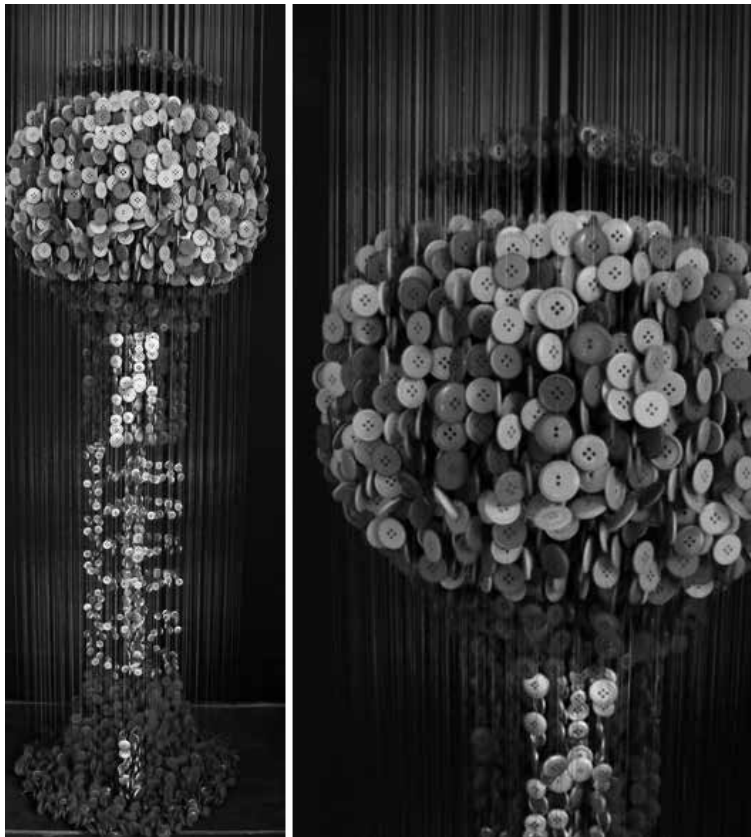
Figura 1. Gumball Machine (Máquina de chicles) (2012), Augusto Esquivel

estudió cinematografía en el Centro Cievyc para la Investigación y Estudio de la Producción de Medios Audiovisuales en Buenos Aires, entre 1997 y 1999. Comenzó su carrera como artista autodidacta en 2009. Él sostiene que «un objeto común utilizado para crear una obra de arte se transforma en algo complicado e intrigante [...]» (Esquivel en Rose Ü, 2013: s/p). Además, explica que se da cuenta de «lo insignificante y pequeño que puede ser un simple botón de costura [...]. Como un átomo en cada molécula cada botón sirve y forma el conjunto» (Esquivel en Rose Ü, 2013: s/p). Por lo tanto, se puede inferir que la metáfora 3 está dada por la utilización del material con el que está realizada la obra.