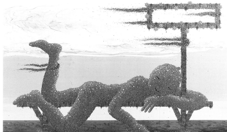
Figura 5. Bodhisattva joven y náufrago (2006), Marcelo Pombo. Esmalte sobre panel. 100 x 150 cm

El pasaje del tratamiento de los árboles hacia la figura humana se verifica después. En una obra posterior, Bodhisattva joven y náufrago (2006) [Figura 5], el cuerpo despreocupado del santo está compuesto en su totalidad por este tratamiento perlado, en modulaciones de tamaño y de brillo, al igual que los tres personajes de otra obra del mismo año, Festival artístico multimedia flotante .