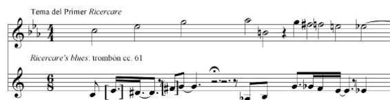
Figura 3. Tema del Ricercare en el trombón del cc. 61

El material del comienzo del Ricercare está muy disimulado en la textura. Aparece por primera vez en el oboe del cc. 28: es el tema invertido (Fa#-Re#-Si-Sib). En forma original, aunque variado, es expuesto por el trombón del GC en el final del cc. 61 del tempo principal (puesto que el GC se desarrolla allí con un tempo diferente de N=164). En el esquema de la Figura 3 se puede comparar el tema del Ricercare con la versión que aparece en la obra de Arias, el trombón articula la blue note presente en la RF cuyas notas extremas coinciden con las del comienzo del Ricercare .