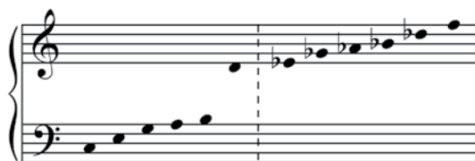
Figura 2. RF-1 de Ricercare's Blues

A partir del cc. 185 aparece la RF-1, es decir, la RF transpuesta un semitono más grave [Figura 2].