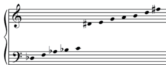
Figura 1. RF de Ricercare's Blues

La registración fija (RF) es un procedimiento típico de la música de los años sesenta 9 que consiste en fijar las alturas a una octava particular del registro, de modo que, cada vez que aparezca una altura determinada (o grupo de alturas) lo hará allí. La que estructura esta pieza fue derivada del acorde mayor/menor con séptima típico del blues (Sib-Do-Mib-Mi-Sol), véase la Figura 1 debajo. A éste se le agregaron hacia el agudo los sonidos necesarios para completar la dominante con novena y séptima mayor (La-Si-Re-Fa#) y, hacia el grave, los propios de la subdominante menor (Fa-Lab) y el napolitano (Reb). Los hexacordios resultantes son simétricos. 10