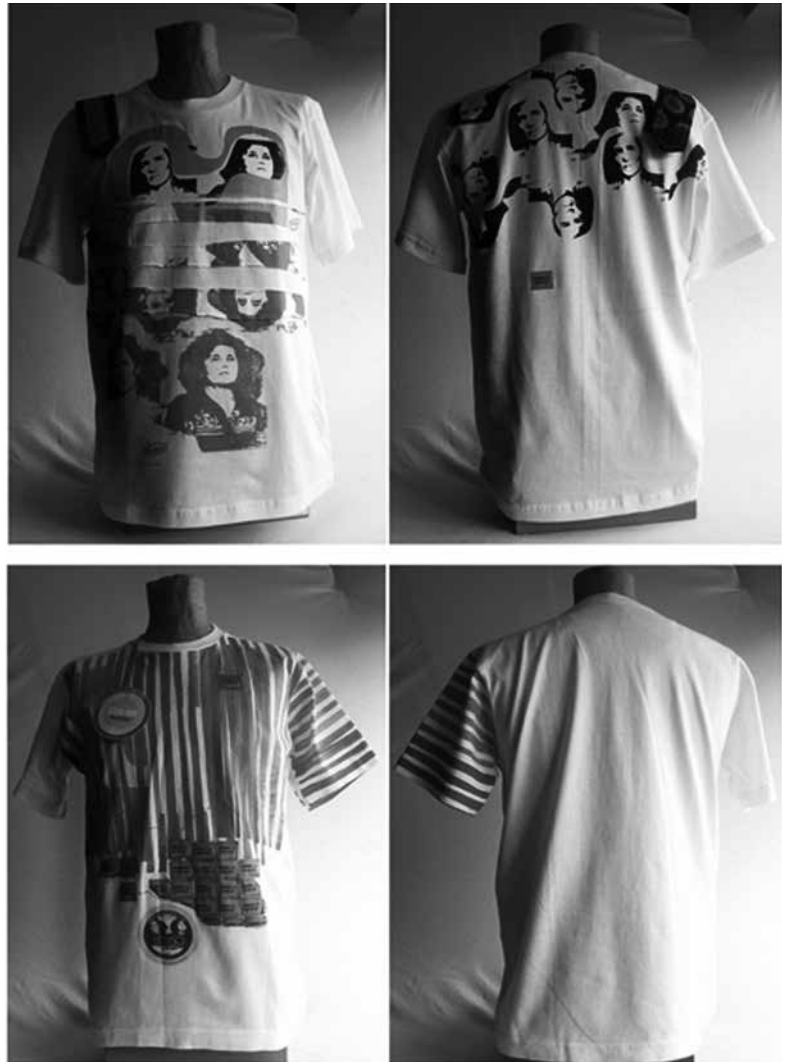
Figura 1. Remeras estampadas realizadas en el marco de la investigación “Sobre la superficie la piel” (2004)

La Bauhaus fue, en ese período, un espacio de discusión por el que transitaron no-