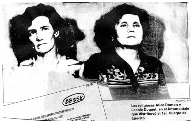
Figura 2. Fotografía de archivo tomada en el Ex Centro Clandestino de Detención de la ESMA (1977)

Para ensayar una respuesta a esta cuestión, cabe mencionar la definición que Jacques Aumont hace del dispositivo. El autor lo define como “un conjunto de determinaciones que engloban e influyen en toda relación con las imágenes”, entre las que se encuentran “los medios y técnicas de producción de las imágenes, su modo de circulación y reproducción, los lugares de accesibilidad y los soportes que sirven para difundirlas” (Aumont, 1992). En estos términos, reducir el campo de la indumentaria a una de estas dimensiones (el soporte) sería perder de vista la compleja relación que se establece entre las producciones que cruzan indumentaria e imagen impresa.