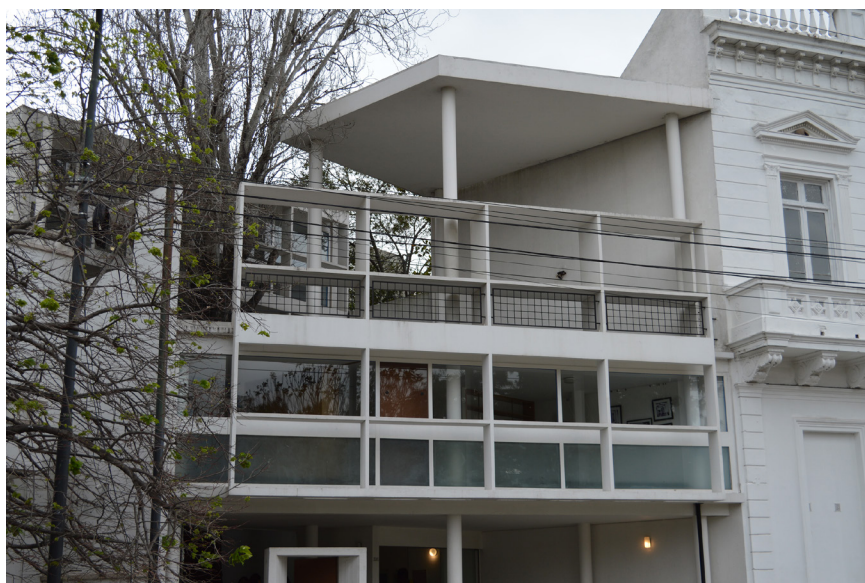
Figura 1. Casa Curutchet, La Plata, Argentina, fotografía, Jimena García Santa Cruz (2023)

Esta diversidad puede observarse de una manera singular a través de artistas de diversas disciplinas que, gracias a la iniciativa del Colegio de Arquitectos de la Provincia de Buenos Aires (CAPBA) de motivar a las personas a acercarse a la Casa, son partícipes de numerosas actividades inspiradas en la Casa Curutchet y/o en la Obra de Le Corbusier, que articulan diferentes disciplinas y privilegian aquellas propuestas colectivas por sobre las individuales. Este vínculo con la sociedad se corresponde con el plan de puesta en valor llevado adelante por el CAPBA. Este plan está fundado en tres ejes: valor cultural, valor edilicio y valor académico añadidos (Bozzano y Santana, 2015).