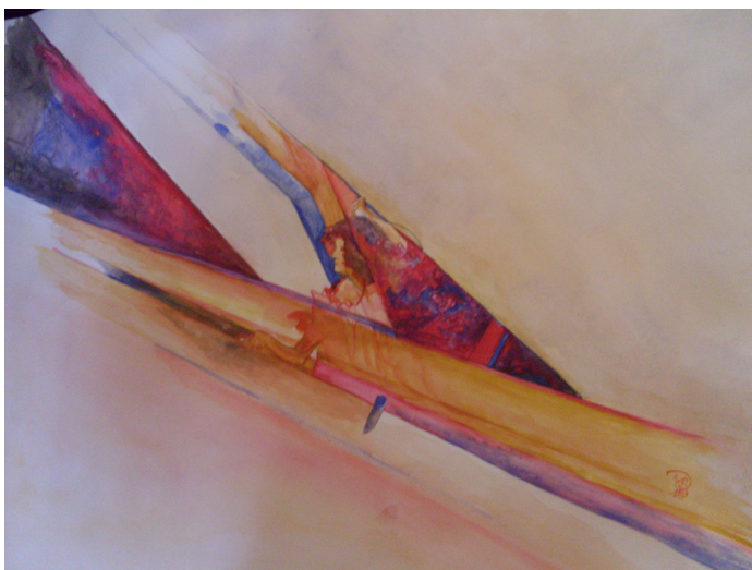
Figura 2. Danza, luz y espacios en la casa Le Corbusier , acuarela, Walter Di Santo, 2015

Al mismo tiempo, se han obtenido interesantes imágenes, adecuadas a distintos lineamientos y lenguajes artísticos, que demuestran que la línea de investigación fue apropiada. Se presentan a continuación, a modo de ejemplo, algunas de las obras de los artistas [Figuras 2, 3, 4 y 5] que integran el equipo de investigación.