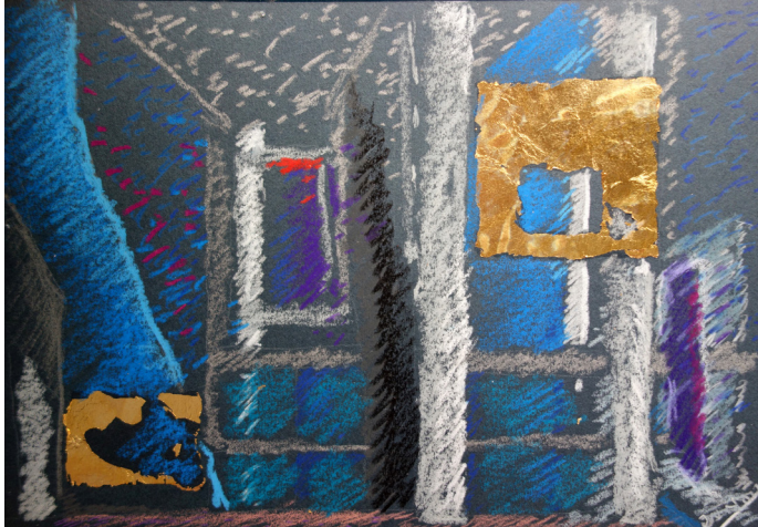
Figura 4. 17, Jorge Bozzano, dibujo de técnica mixta, c. 2020.