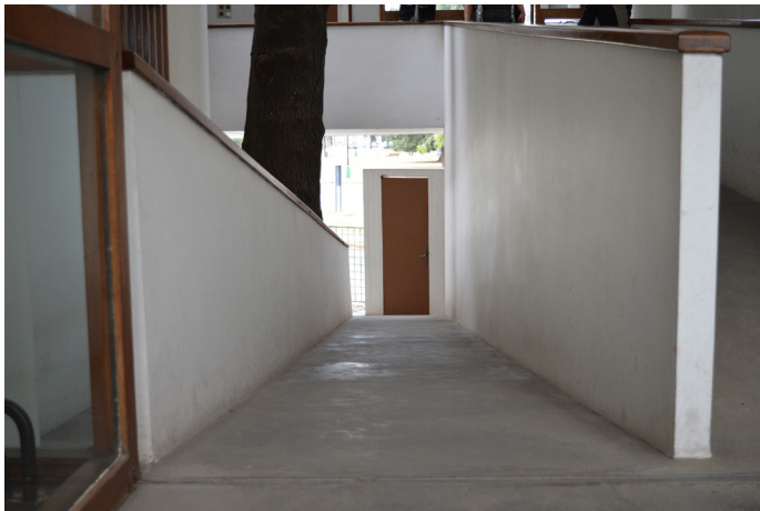
Figura 5. Ritmo y continuum Nro. 2, fotografía, Jimena García Santa Cruz, 2023