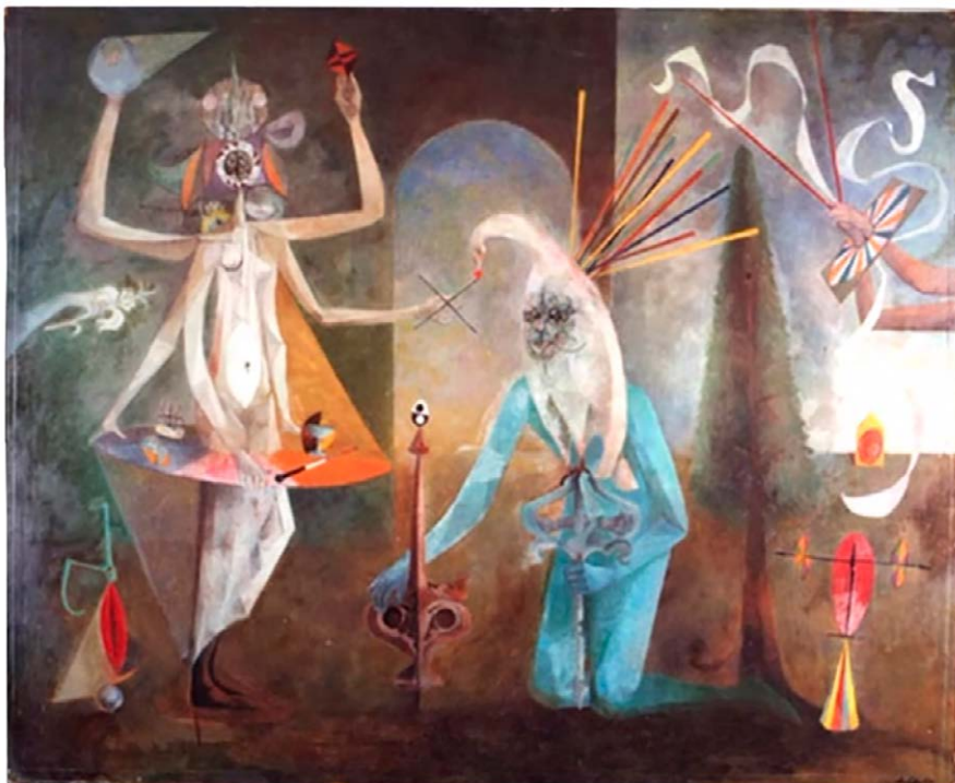
Figura 1. Hierogamus (1953), de Juan Andralis [Pintura]. París, Francia: Colección El Archibrazo

Andralis realizó un viaje a Grecia con la idea de visitar a su abuela, y aprovechó para recorrer diferentes monasterios y acercarse a sus manuscritos. Esta enriquecedora experiencia, sus estudios acerca de la alquimia y el origen del símbolo , sumado a su acercamiento al budismo tras conocer a un particular personaje al que llamaba «señor Szoun», 3 tuvieron, sin lugar a duda, un fuerte impacto sobre su personalidad.