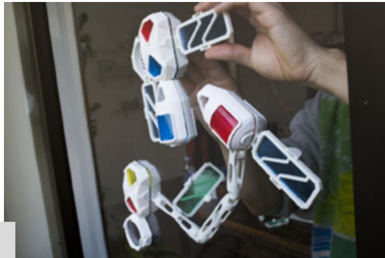
Figura 3. Registro de una estación modular en construcción

Uno de los desafíos que enfrentamos en este contexto de tecnologías tan desarrolladas (inmaterialidad, virtualidad) está vinculado a la hiperestimulación de nuestras experiencias. Resultó interesante, entonces, tomar y explorar los métodos de estimulación ( feedback ) para aplicar con juegos de materialidad modular.