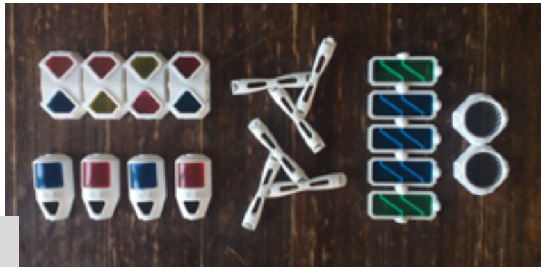
Figuras 1 y 2. Tarjetas y modelos para construir la estación