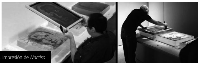
Figura 2. Impresión de Narciso

En las obras abordadas, el artista optó por ensayar y por crear un método que propone una original variación de la técnica serigráfica extendidamente conocida. Conserva una de las herramientas fundamentales del procedimiento: el shablón emulsionado con una imagen de apariencia fotográfica, el cual actúa de matriz. Sin embargo, establece una innovadora elección de materiales que se relacionan entre sí: en lugar del papel o de la tela, el agua es el soporte del grafito, y este último reemplaza a la tinta y es aplicado con pincel y no con manigueta, como se hace originalmente en esa técnica perteneciente al sistema de impresión por estarcido.