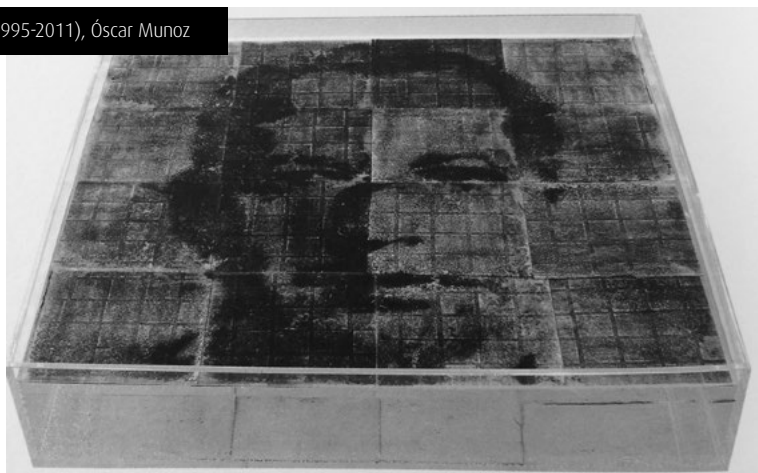
Figura 3. Narcisos (1995-2011), Óscar Muñoz

En Narcisos , al comienzo los espectadores pueden distinguir imágenes que con su nitidez nos enseñan detalladamente los rasgos de algunas personas. Esa certidumbre de la representación mimética, que en apariencias cumple con la