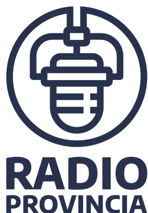
Figura 1. Propuesta de signo marcario