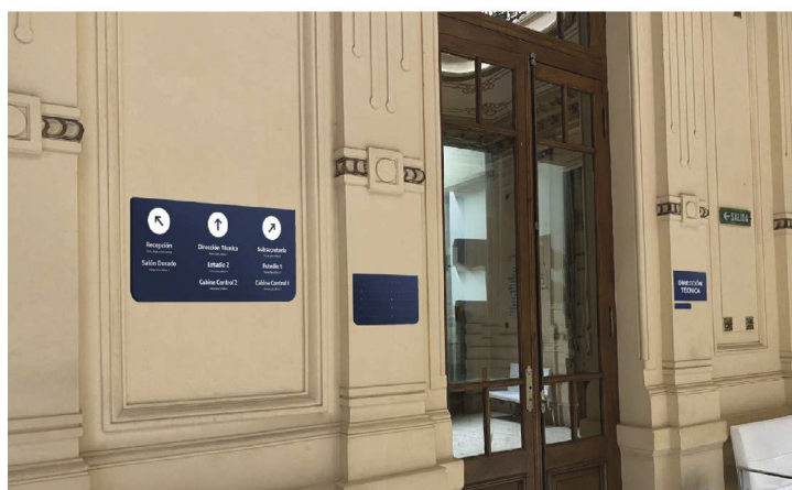
Figura 2. Cartelería interna

El punto de partida fue la construcción de un signo marcario que represente tanto a la radio como a la provincia, sin dejar de lado la idea de unión, consolidación y colectividad, así como los propios valores de la emisora. Busqué la simplicidad con una identidad actual y pregnante [Figura 1]. La fuente tipográfica principal utilizada fue Encode Sans, bajada del manual de marca de la provincia de Buenos Aires. Como fuente secundaria se usó la fuente Alata, la cual fue empleada tanto para el eslogan como para piezas gráficas.