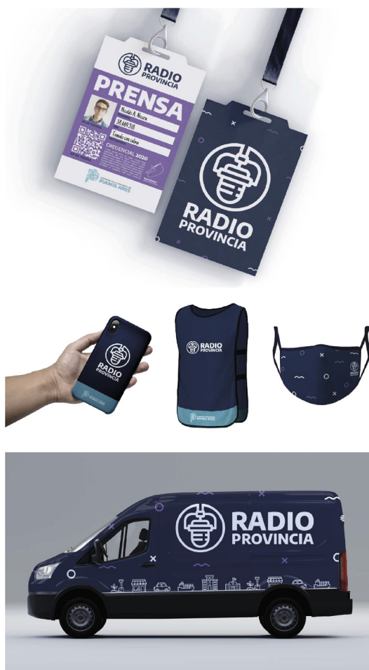
Figura 3. Gráfica vehicular y elementos para movileros

Hice dos sistemas de afiches para la vía pública. Uno tiene la intención de destacar los referentes que participan en la programación a través de una fotografía y de un texto con el título del programa. El segundo busca generar empatía con el oyente mediante interpelación con fotografías que muestran situaciones cotidianas donde la radio está presente y la frase que acompaña la foto hace alusión a los distintos programas que se emiten [Figura 4].