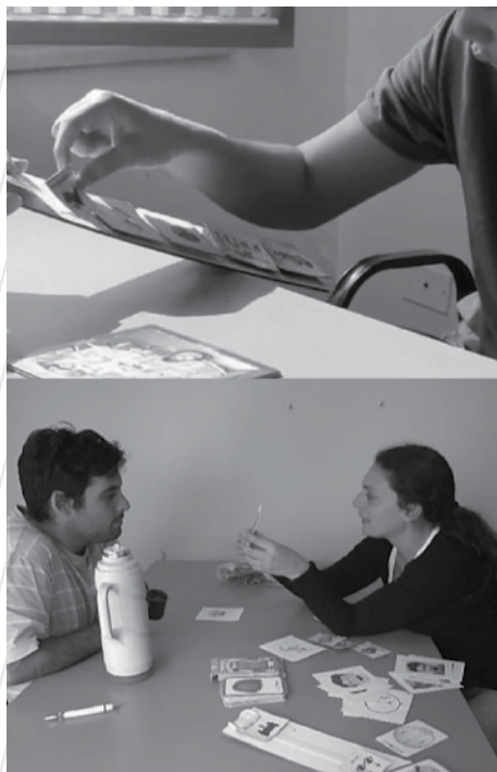
Figura 4. Testeos individuales de material didáctico realizados durante 2013 y 2014 en los consultorios de Apadea, en La Plata

Bárbara Ruiz, fonoaudióloga del mismo equipo, añade: «Hay un tema más profundo: en otros países se hablan otros idiomas, por ejemplo el inglés, y no todos tenemos acceso al idioma. Entonces el material importado se convierte en una barrera más que en una ayuda» (Ruiz en Amat, 2013b).