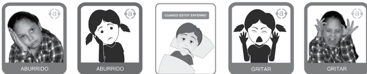
Figura 2. Prototipado de tarjetas de comunicación. Diferentes niveles de abstracción

La aproximación personal a la muestra, la observación de las actividades realizadas en escuelas y en instituciones ligadas a la temática, sumada a la opinión de especialistas, y el testeo del material en sus ámbitos cotidianos de aplicación (medio a través del cual se evaluó la respuesta e interpretación de los propios niños en base a criterios de cromaticidad, síntesis de la imagen, realismo y niveles de abstracción, simbología, función del texto, estructura y sistematización visual), dio como resultado la validación de la hipótesis planteada en una primera instancia. La misma afirma que el material didáctico para niños con autismo no puede realizarse de manera estrictamente estandarizada con relación a cuatro causas: cada caso clínico de autismo es único e irrepetible; la individualidad de las personas con autismo, sus intereses y sus hábitos particulares; las diferencias culturales y