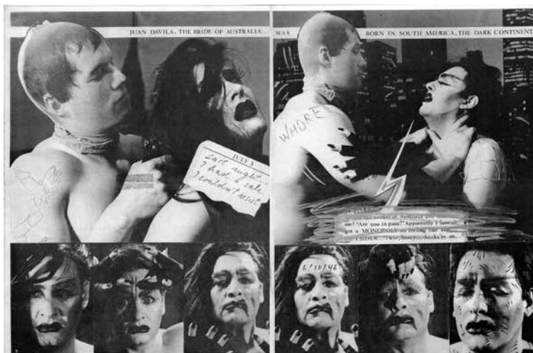
Figura 4. The Kiss of Spider Woman (1981), Juan Domingo Dávila. Fotonovela

original mediante las estrategias visuales del homoerotismo, la pornografía y el travestismo.