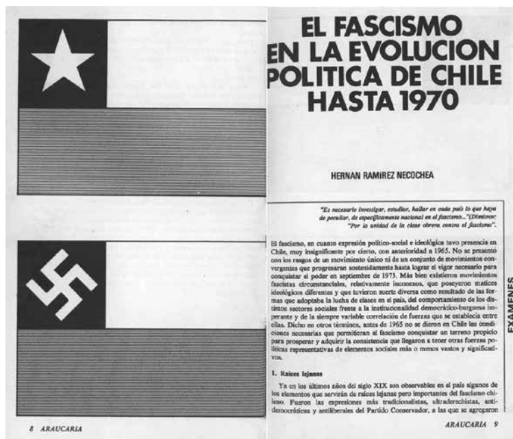
Figura 3. Araucaria de Chile 1 (1978). [Sin dato]. Arte editorial