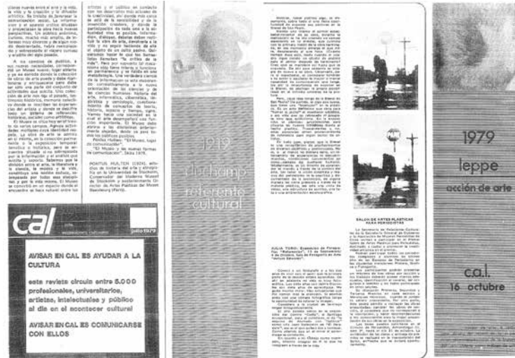
Figura 1. CAL, N.º 3 (1979). Carlos Leppe, arte editorial

La última columna en la página veinticinco incluye una fotografía de la nuca de Duchamp; de su boca sobresale una pipa y en la parte de atrás de su cabeza tiene rasurada la figura de una estrella. A continuación, aparece una serie de renglones de textos en orden de arriba a abajo: «1919», «Duchamp», luego una línea horizontal antes del texto «Referente cultural» y finalmente «Tonsura 1919 para acción de arte corporal» (CAL, 1979: 25). Al dar vuelta aquella página, que está del lado derecho, una nueva intervención del artista emplea la cuarta columna de cuatro para sobreponer otro aviso que narra la intervención anterior. En orden de arriba a abajo, un detalle de la fotografía de Marcel Duchamp enfatiza la «tonsura» en forma de estrella sobre su casco y es seguido por los textos «1979» y «Leppe»; por último, otra línea horizontal antecede a los textos «Acción de arte», «C.A.L.», «16 de octubre» y «Acción de arte a realizarse dentro del marco de la exposición: altamirano/revisión de la historia del arte chileno como trabajo de arte», todo con una diagramación con mucho aire y una composición de autor.