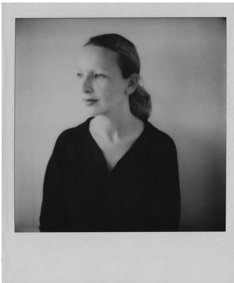
Figura 5. [Sin título] (1980), Francisco Zegers. 9 Fotografía instantánea SX-70

y uno de los más importantes es que constituyó lo que la teoría denomina como una «inversión de escena» (Richard, 2015), al salir del cánón histórico-geográfico tradicional y establecer un punto de ruptura desde la cultura sudamericana marginal.