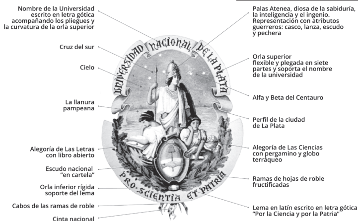
Figura 1. Componentes iconográficos del escudo de la UNLP

Una vez que tuvimos todo el material relevado y clasificado, se realizó un diagnóstico en el que detectamos que, a causa de la superposición de intervenciones desconectadas, convivían aplicaciones y versiones varias que atomizaban la representación del escudo y de la marca de la UNLP y afectaban la coherencia de la identidad visual institucional. Específicamente respecto al escudo, la bibliografía consultada coincidía en que «los antecedentes del actual Escudo y Sello Mayor presentan variantes notables, como lo demuestran las investigaciones realizadas últimamente» (Bongiorno, 1959) 4 y circulan aún en la actualidad versiones distintas, lo que también impactaba respecto a la aplicación del escudo con técnicas y medios diversos, ya sean grabados, impresos o electrónicos [Figura 2].