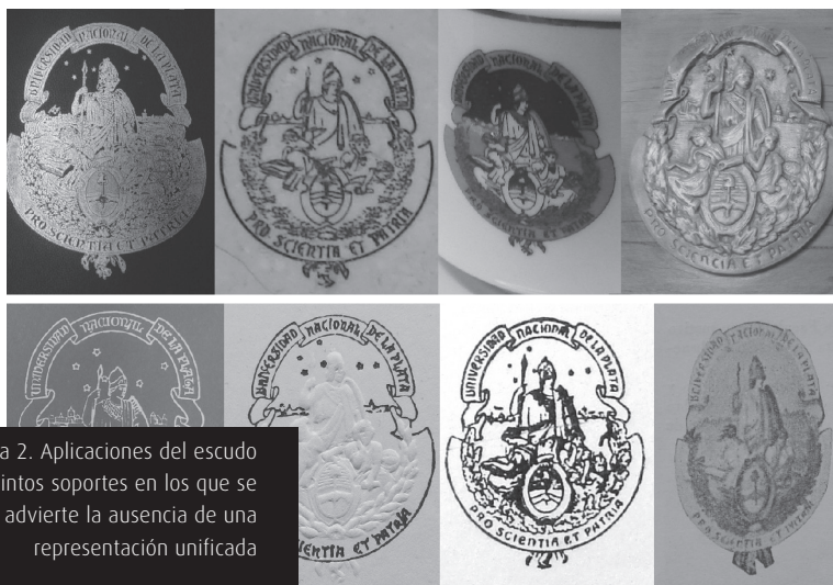
Figura 2. Aplicaciones del escudo en distintos soportes en los que se advierte la ausencia de una representación unificada

Para ordenar los problemas detectados y para poder abordarlos, se agruparon en los tres niveles de análisis de los signos planteados por la semiótica: sintáctico (relaciones formales), semántico (significados) y pragmático (cuestiones prácticas). De este modo, observamos que el escudo poseía una construcción singular y se enmarcaba en lo que, dentro del universo de los signos de universidades creadas o heredadas del siglo XIX, pudimos establecer como una tipología de escudos alegóricos .