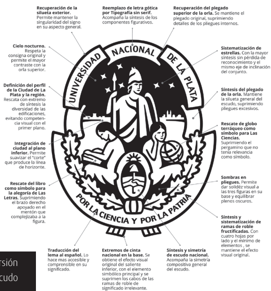
Figura 5. Decisiones en la versión final del rediseño del escudo

Planteamos como metodología un avance del equipo en paralelo e hicimos proyecciones individuales y grupales, con reuniones semanales para analizar avances y para discutir puntos de vista. Muchas propuestas se interrumpieron en una fase inicial, otras quedaron a mitad de camino y otras tantas se descartaron con un alto grado de desarrollo en función de dar paso a aquellas soluciones que las superaban. Al respecto, hay que decir que el trabajo requiere, además de compromiso, de renuncia por parte de los miembros del equipo. Aunque puede haber algunas propuestas con cierto grado de validez, resulta necesario desprenderse de ellas y se produce una suerte de duelo respecto a posibilidades que nunca serán. En este sentido, durante las distintas etapas del proceso de trabajo recibimos aportes valiosos del área de comunicación institucional y de las autoridades de la Universidad a partir de informes detallados que íbamos elaborando en momentos clave. También se mostraron avances de las distintas etapas del trabajo a colegas, a través de artículos y de ponencias en jornadas científicas (Passarella, 2012, 2013, 2014), y a un público más amplio mediante charlas, 5 a fin de compartir reflexiones y de recibir puntos de vista que ampliaran nuestra mirada. Una vez que se revisaron las últimas alternativas, la propuesta comenzó a centrarse en las decisiones finales que dieran paso a la versión definitiva [Figura 5].