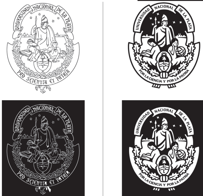
Figura 4. Versión anterior y rediseño, en una tinta, y aplicados sobre fondos claros y oscuros

Para que el escudo quedara siempre en positivo tanto sobre fondos claros como oscuros, bordeamos el contorno con una línea que tuviera suficiente presencia sobre tonos claros y que, al desaparecer sobre tonos oscuros, no se notara su ausencia [Figura 4].