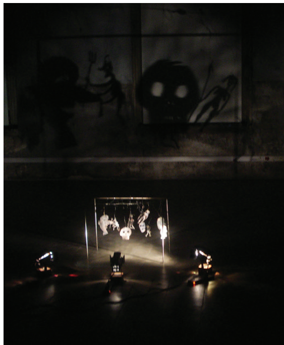
Figura 4. Escena de figurillas y proyección en teatro de sombras

La otra sala es radicalmente diferente a las anteriores: es una sala cerrada. A través de los vidrios de la puerta pueden observarse pequeñas figuras, ásperas y grotescas, cuya proyección sobre el plano de fondo genera una especie de danza macabra. La instalación tiene un aire siniestro, que se mezcla con cierta resonancia infantil producida por la sencilla técnica del tradicional teatro de sombras [Figura 4]. En el espacio transversal, a ambos lados del pasillo, se ordenan en semicírculo percheros con sacos negro colgados, uno por cada perchero, también con fundas de transparentes, e iluminados con luces frías [Figura 5]. Alrededor hay largos asientos de material – los asientos del Hotel – que hablan de tiempos de espera. Y a la izquierda, en una oscuridad casi absoluta, una especie de mesa o mesada, con una superficie irregular, también envuelta en nylon. El olfato, más que la vista, permite dar cuenta de que debajo hay flores muertas.