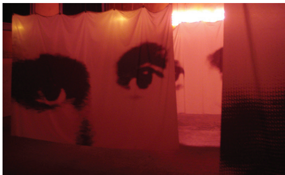
Figura 2. Vista parcial de la sala con sábanas impresas

extrañadas, expectantes. La iluminación es pobre, con lamparitas de tungsteno con el cableado a la vista, y en la pared un cartel de bienvenida, escrito con luces de neón.