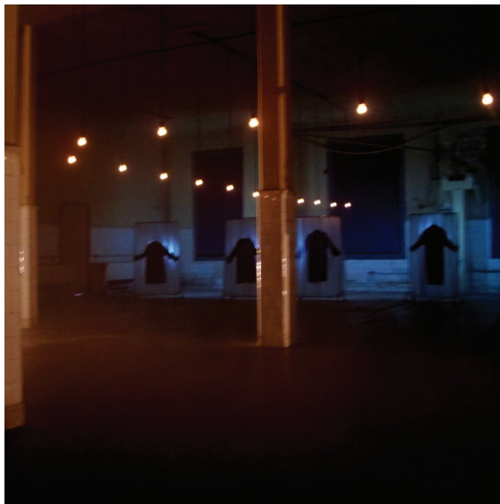
Figura 5. Ronda de percheros intervenidos

Víctor Zamudio-Taylor afirma que en la instalación el recurso de la alegoría opera como manera de representar la historia de modo resumido y a la vez fragmentado, lo que permite articular el pasado de manera vital.