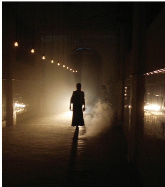
Figura 1. Vista del pasillo central de la instalación, con circulación de público

Esta tensión se actualiza en la instalación de Boltanski, quien en una entrevista explicó su primer encuentro con el espacio de esta forma: